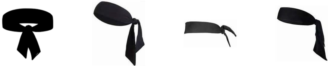
Figura 1 - Esempi di bandane

4-4 Precisazione: Non è consentito indossare bandane.