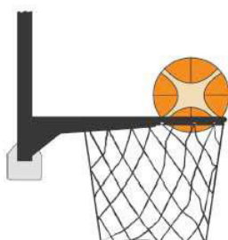
Figura 4 - Palla dentro il canestro