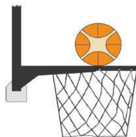
Figura 3 - Palla a contatto con l'anello

31-19 Precisazione: Una violazione di interferenza è commessa da un difensore o da un attaccante durante un tiro a canestro su azione quando un giocatore tocca il canestro (anello o retina) o il tabellone, mentre la palla è a contatto con l'anello ed ha ancora la possibilità di entrare nel canestro.